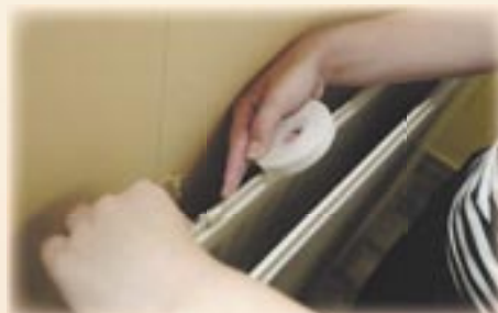
6. Plak het dubbelzijdig tape op de bovenrand van de radiator.