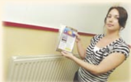
2. De HR-radiatorfolie moet aan de achterzijde van de radiator worden bevestigd.