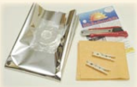
1. Benodigd gereedschap: Stanleymes, wasknijpers en schoonmaakdoekje.

Zo maakt u eenvoudig van uw LAAG RENDEMENT radiator een HOOG RENDEMENT radiator!