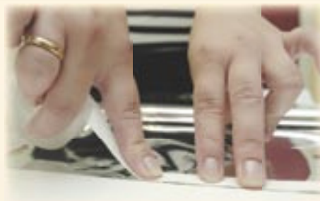
3. Plak het meegeleverde dubbelzijdig tape op de rand van de HR-radiatorfolie.