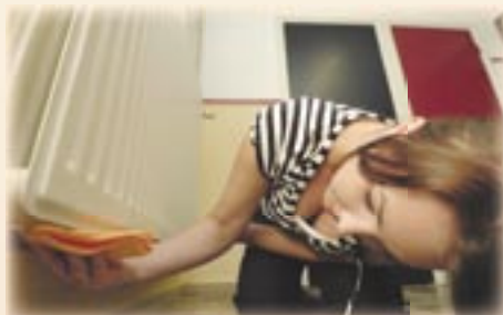
5. Maak aan de achterkant van de radiator de randen schoon.