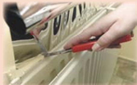
11. Snij met een scherp mes de folie af en doe vervolgens de volgende baan.