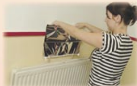
8. Verzwaar de onderkant van de folie met enkele wasknijpers en laat de folie achter de radiator zakken.