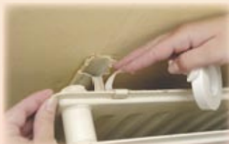
7. Maak een deel van de bescherm laag los en vouw deze om.