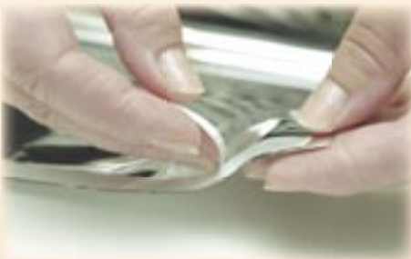
4. Maak de bescherm laag gedeeltelijk los en vouw deze om.